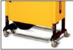
Zweites Fusspedal Für beidseitige Bedienung