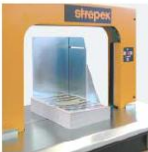
Paketanschlag Zum Ausrichten von losen Bündeln