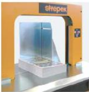
Paketanschlag Zum Ausrichten von losen Bündeln