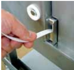
Einfacher Bandwechsel, automatischer Band-einzug