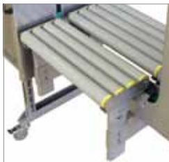
Verschiedene Optionen Optimale Anpassung an unterschiedliche Betriebsverhältnisse und Anforderungen