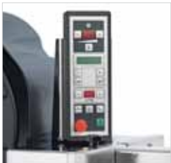
Einfache Einstellungen, drehbares Bedienpanel