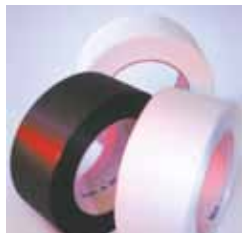
Wirtschaftliche Bänder für schonendes Umreifen Verwendung von dünnen PP-Bändern