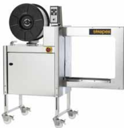
SMG 65i / SMG 65iS