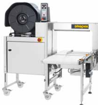
SMG 75i / SMG 75iS