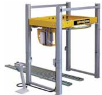
"Roll in – Roll out" -Lösung