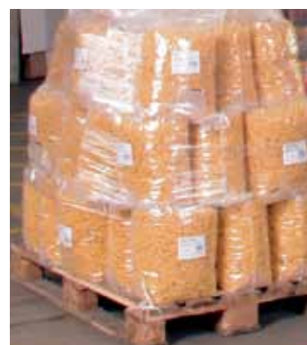
Speziell geeignet für Betriebe mit Hygienevorschriften